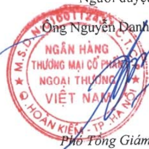
Phó Tổng Giám đốc